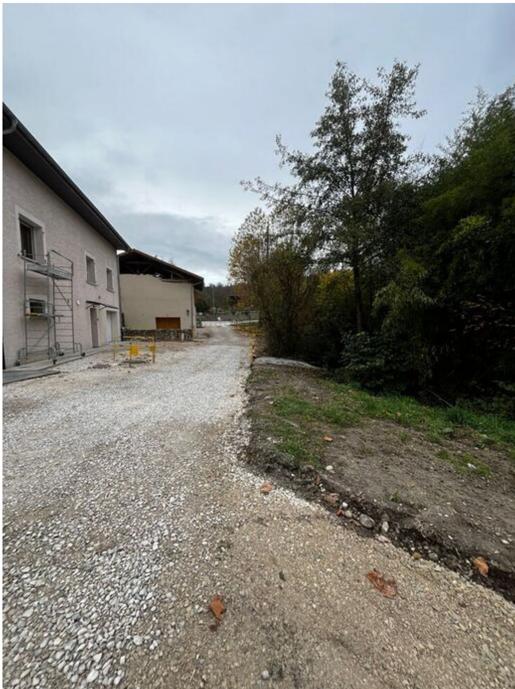
Travaux Route de la Scierie