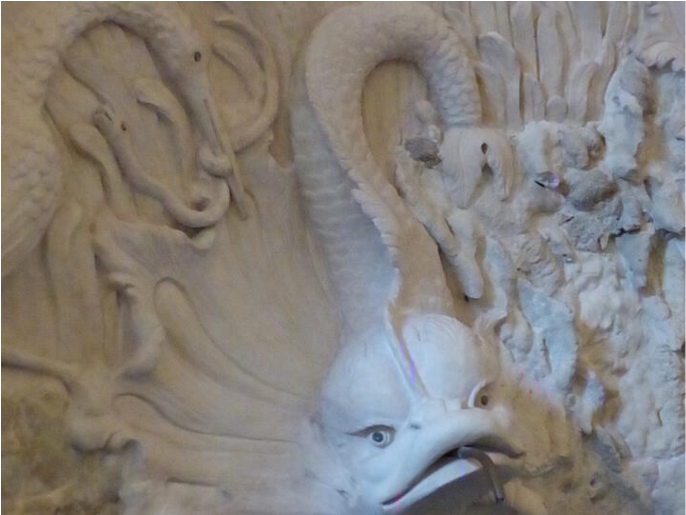
Visite guidée Saint-Antoine au fil du temps - Le temps du renouveau : art et collections 38160 Saint-Antoine-l'Abbaye

Visite permettant de découvrir des espaces qui ne sont pas ouverts au public.