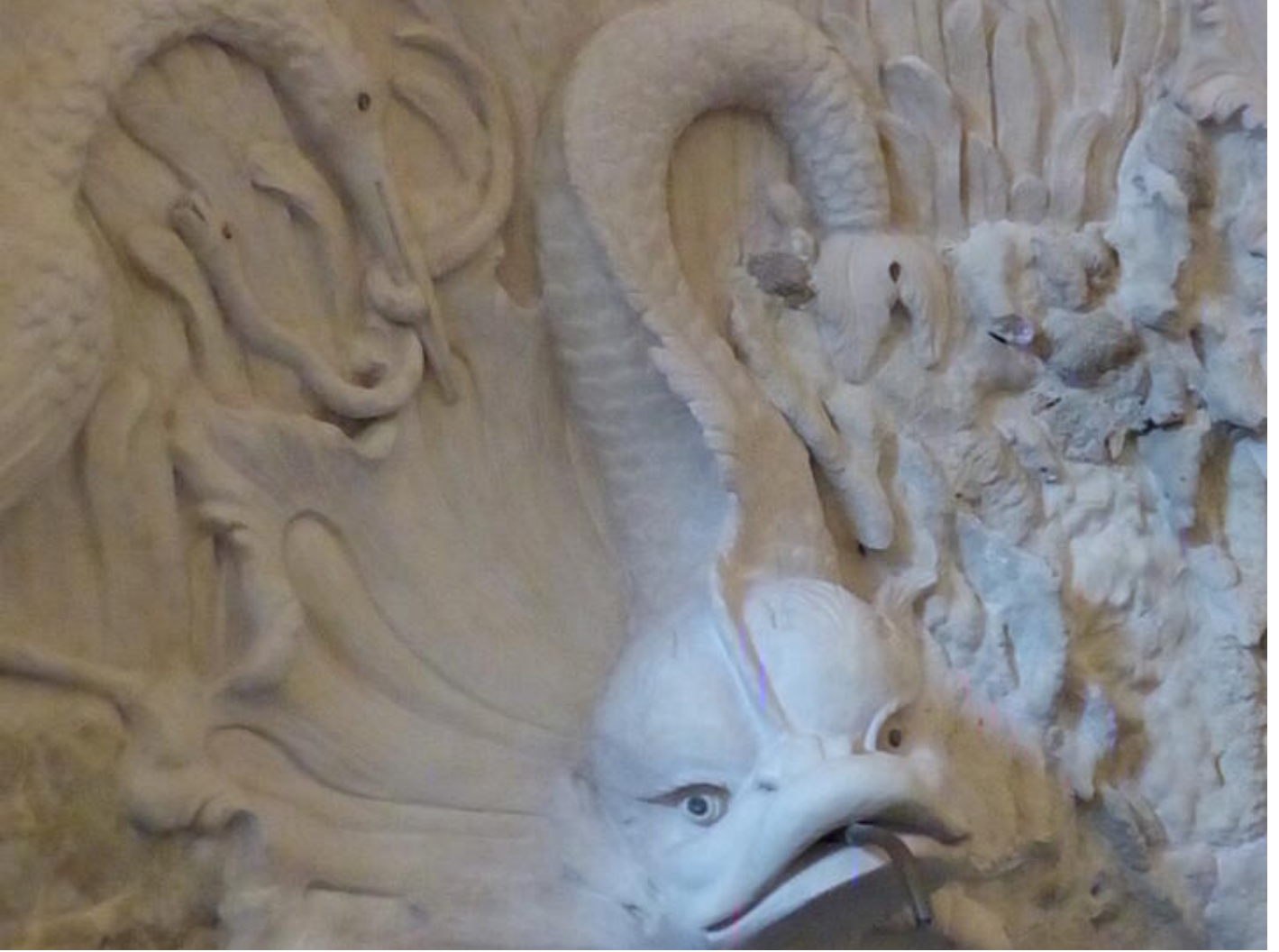
Visite guidée Saint-Antoine au fil du temps - Le temps du renouveau : art et collections